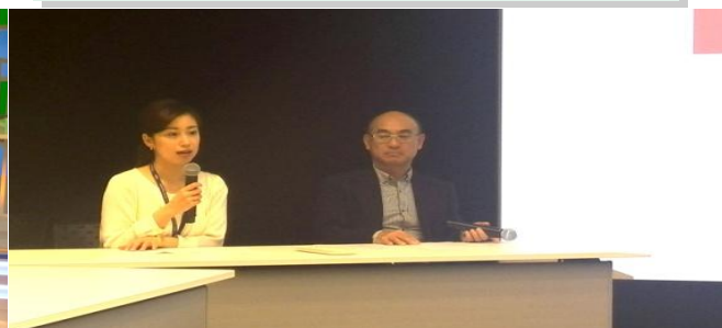
《Mプラス11製作者との懇談時間》

■放送直前のスタジオで、原稿見本に沿ってカメラに向かって報道内容を発声。その後ニュース「Mプラス11」生放送を見学しました。副調整室(サブコントロールルーム)の見学:プロデューサー以下多くのスタッフの秒単位の緊張感満ちた仕事振りに見学側も緊張!