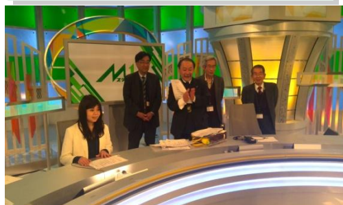
《ゲストの女性がキャスター経験》

■放送直前のスタジオで、原稿見本に沿ってカメラに向かって報道内容を発声。その後ニュース「Mプラス11」生放送を見学しました。副調整室(サブコントロールルーム)の見学:プロデューサー以下多くのスタッフの秒単位の緊張感満ちた仕事振りに見学側も緊張!