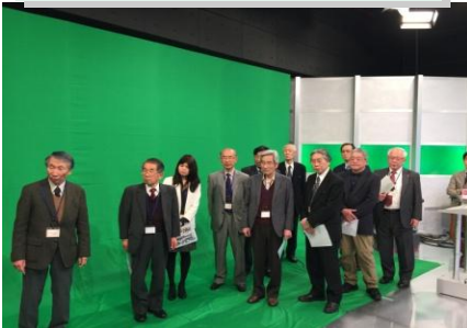
《全員でスタジオの設備を見学》

■ゲストの方、6名とKIRCメンバー6名の計12名で新装ビルのスタジオを訪問しました。「所さんの学校では教えてくれないそんなトコロ!」の収録準備中。総務の2名方の誘導・説明:照明ライトが100%LEDに変更され、室温上昇が回避された事実に感心。