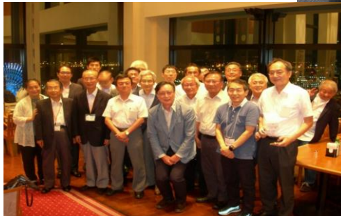
8/17 夏季会員会・懇親会 開催