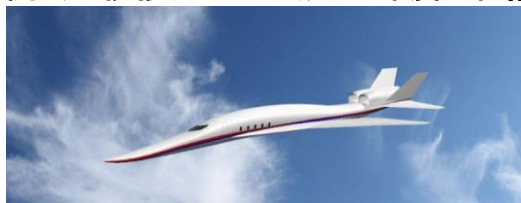
←11/18 航空機産業の近未来 セミナー開催