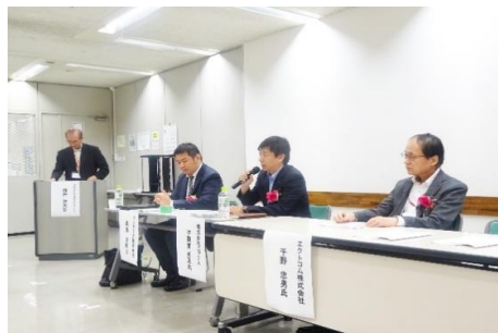
6/22 リンカーズ・KIRC フォーラム開催