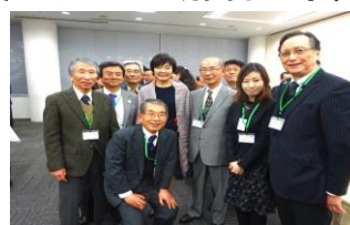
2/27 ミャンマー → フォーラム in 川崎 開催