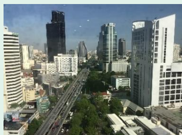
↑バンコク市内を見下ろす