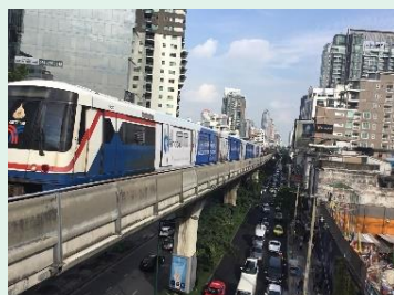
↑道路上のBTS (高架鉄道)